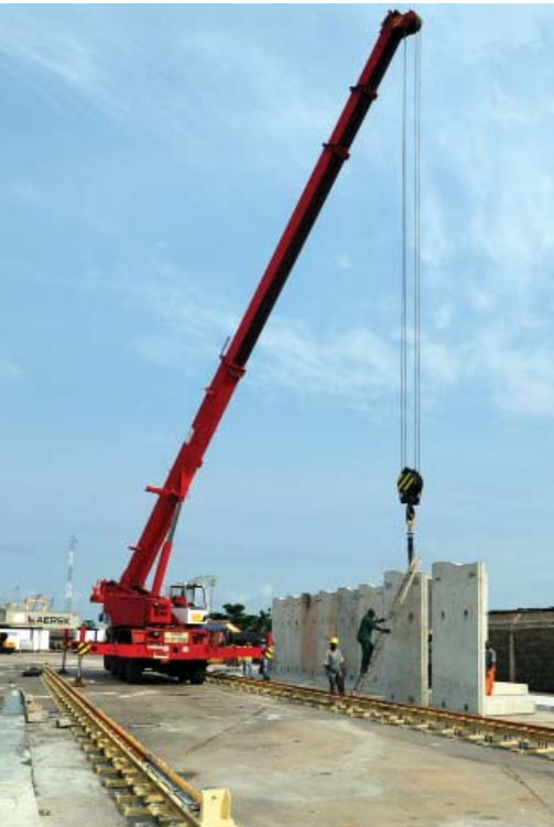
Escáner de pórtico en construcción

Los proyectos de escaneo de carga llave en mano suelen tomar la forma de un contrato BOT (Build-Operate-Transfer) o un contrato de concesión que consta de las siguientes etapas: