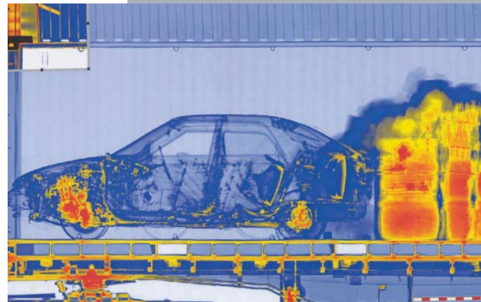
Imagen radioscópica Automóvil oculto en un contenedor