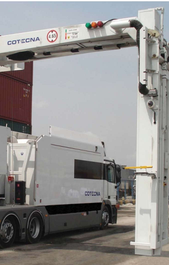
Escáner móvil en funcionamiento

Los operadores de comercio exterior enfrentan continuamente crecientes retos en la ejecución de sus actividades. Las tecnologías avanzadas y de inspección no intrusiva (NII por sus siglas en inglés), que asocian equipos de alta calidad y servicios eficientes proporcionados por una entidad independiente, experimentada y confiable, pueden considerarse la respuesta más adecuada a las necesidades de los sectores involucrados: