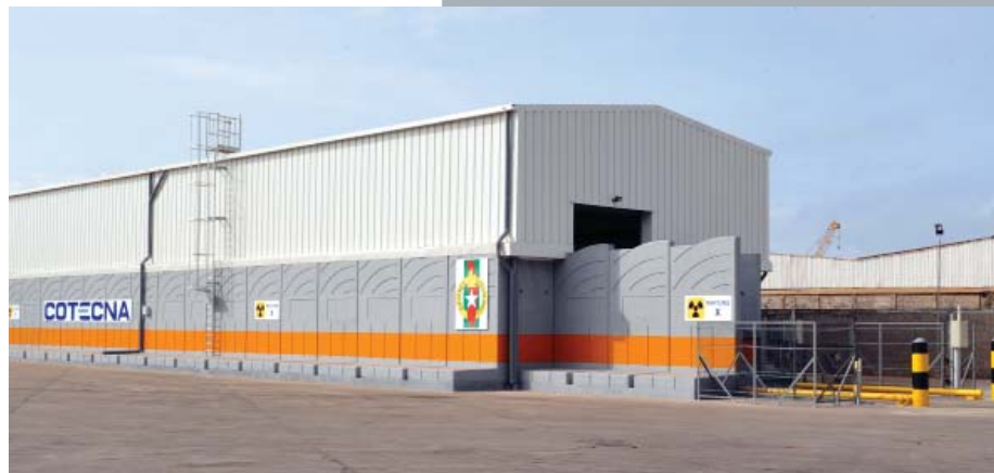
Instalación de escáner de pórtico reubicable

El grupo Cotecna ha registrado un importante crecimiento en los últimos 10 años, y cuenta con una plantilla mundial de unos 4.000 profesionales y agentes, con cerca de 100 oficinas en el mundo. Nuestra experiencia probada y comprobada se deriva de más de 35 contratos de servicios de inspección gubernamentales.