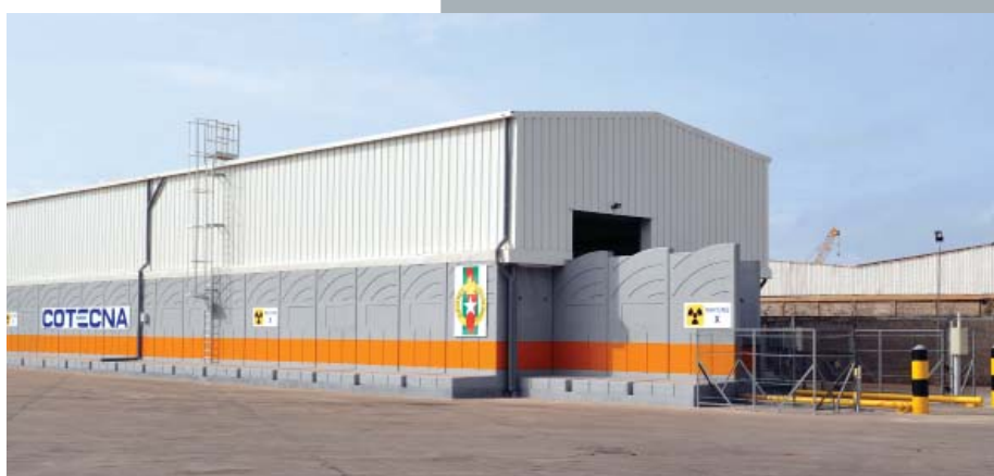
Instalación de escáner de pórtico reubicable

El grupo Cotecna ha registrado un importante crecimiento en los últimos 10 años, y cuenta con una plantilla mundial de unos 4.000 profesionales y agentes, con cerca de 100 oficinas en el mundo. Nuestra experiencia probada y comprobada se deriva de más de 35 contratos de servicios de inspección gubernamentales.